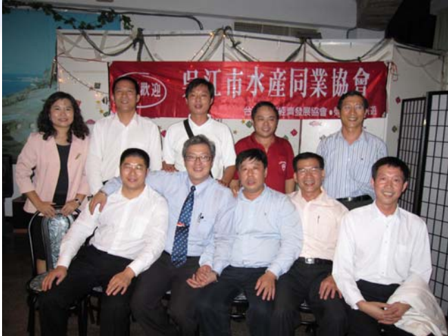
座談會後合影留念

2008年南方澳鯖魚節11月22及23日熱鬧登場，本協會參與部分活動，並協同辦理鯖魚產業與南方澳社會經濟論壇 97年度南方澳鯖魚節將於97年11月22-23日由蘇澳區漁會舉辦，在蘇澳鎮南方澳第3漁港廣場前盛大舉辦，本會基於蘇澳區漁會為