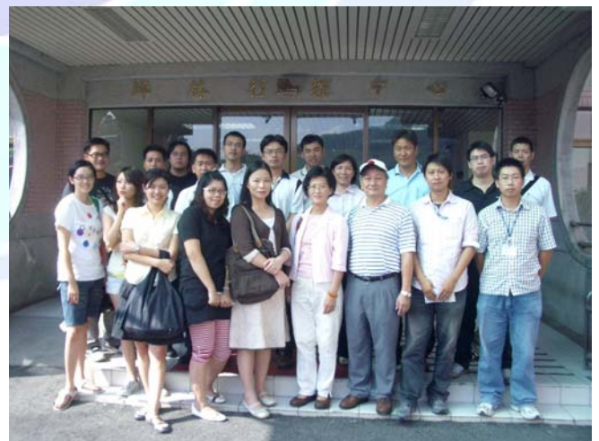
漁船動員組訓研討會學員置坪林行控中心參訪

9 月 19 日在結束早上的課程並舉行面對面座談，學員們提出相當多實際的問題，並主辦單位漁業署及蒞臨之交通部及海巡署的長官來解答，雖說不能達到賓主盡歡之境界，但也算是圓滿成功，在用過簡便之午餐後，便一行人驅車前往坪林行控中心，我們都知道坪林行控中心位於坪林鄉雪山隧道北口端，負責國道 5 號機電設備及交控設施監控及操作任務，尤其國道 5 號(蔣渭水高速公路)全長 55 公里為臺灣第一條貫穿雪山山脈的高速公路，除了縮短台北宜蘭兩地間行車時間更加有效的改善了宜蘭地區的聯外交通，紓解東部鐵路、北宜及濱海兩公路的負擔，而坪林行控中心更是肩負起整條國道順暢及安全的重責大任，也經由此次的參觀讓學員瞭解如何危機處理的狀況。