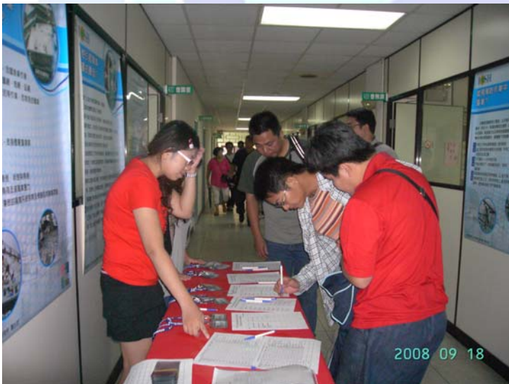
漁船動員組訓研討會 9 月 18 日報到情形

9 月 18 日當日由本會施執行秘書在台北車站會合北部地區的參加人員，並到松山機場在遠從澎湖區漁會而來的學員後，隨即區車直達到基隆區漁會報到，由協會的會計林小姐及永續協會簡小姐負責報到事務，隨即展開了一連續的 2 天 1 夜的精彩課程，此次參加的學員有交通部交通動員委員會、北區各縣政府、區漁會、及海岸巡防署等相關業務主辦人參加，共計有 33 人參與。