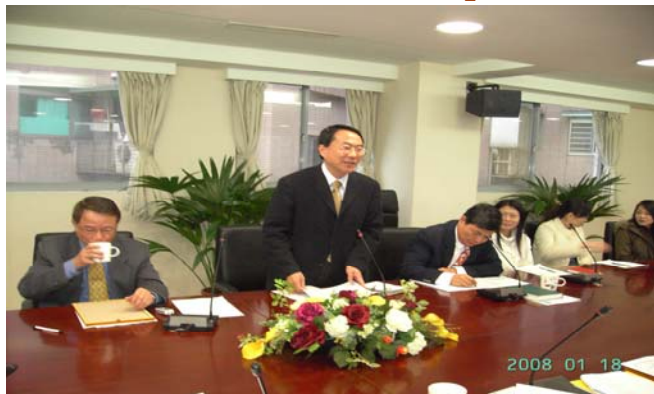
漁業署謝大文專題演講

在結束本會第 3 屆第 2 次理監事聯席會議會後，秘書處邀請行政院農業委員會漁業署謝大文署長為本會專題演講，針對目前全省各區漁會的問題進行探討及充分之討論，雖然漁業署是漁會的主管機關，但漁會本身應該對自己的財源妥善的規劃，為自己的將來有打算，需要未雨綢繆，而不是財務不佳時才想到漁業屬長官可以幫忙，也希望藉由此演講能喚起各漁會將來自己的定位及未來的前途在哪裡？