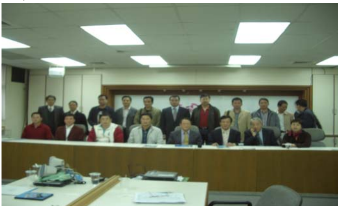
座談會後合影留念

相顧於台灣同樣擁有豐富的海洋與水產資源，如何兼顧漁業經濟發展與生態平衡，創造環境、漁民及消費者的三贏，是值得精益求精的課題。透過彼此專業人士的相互往來訪問，期望藉由座談研討及實地參觀考察，交換彼此在水產養殖技術與漁業經營專業上的成功經驗與心得。