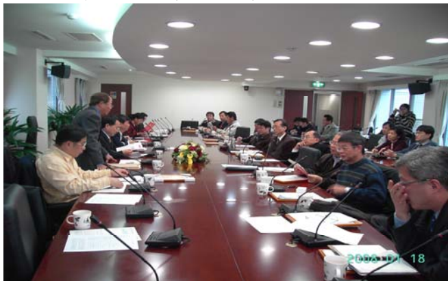
第3屆第2次理監事聯席會議開會狀況