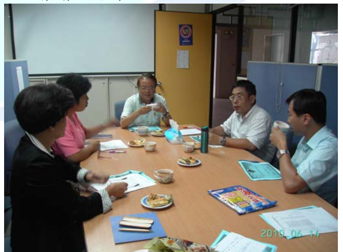
第三屆第 5 次常務理監事聯席會議