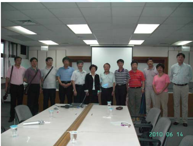
座談會後一同合影

產資源，如何兼顧漁業經濟發展與生態平衡，創造環境、漁民及消費者的三贏，是值得精益求精的課題。透過彼此專業人士的相互往來訪問，期望藉由座談研討及實地參觀考察，交換彼此在漁業經營專業上的成功經驗與心得。