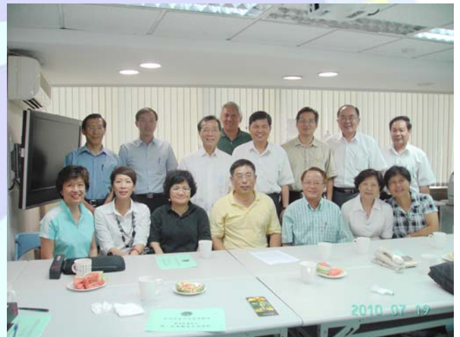
第四屆理監事合影留念