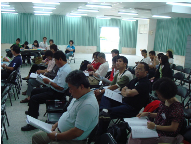
第四屆第 1 次會員大會開會情形

案由三通過 98-99 年度新加入之個人永久會員 4 位、個人會員 2 位，新加入之個人永久會員 4 位：黃麗香：漁閩代書負責人；施淵源：協會執行秘書；陳鳳珠：台北地區