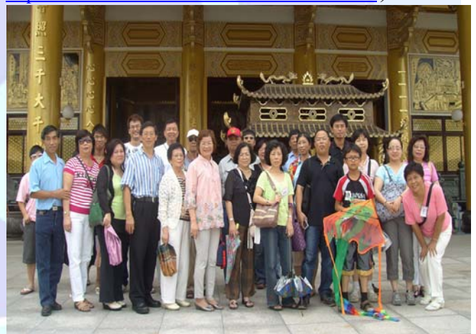
會員們在天台山合影留念

http://cc.kmu.edu.tw/~m700070/SINWI/SW.htm )