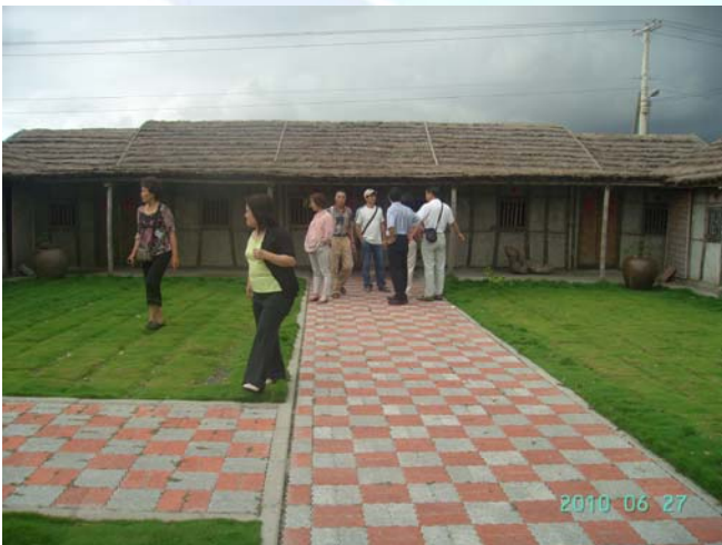
王功漁港近年來彰化縣政府投入相當多資源推動觀光

仔則是王功特產,在王功海堤旁有多家餐廳供選擇,芳漢路王功美食街可吃到俗稱蚵仔嘜的「炸粿」,外皮香脆,可依喜好選擇內包韭菜、蚵仔、豬內或花枝,再搭配炒蘆筍、蚵仔湯。再配上多家現炒的鹽炒花生,口味各具特色。(以上資料由