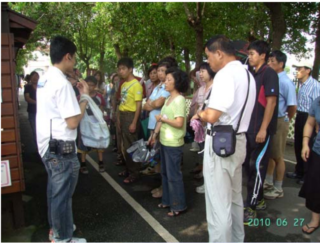
解說員為大家介紹毛巾製造過程

產品 DIY (蛋糕@毛巾,可愛毛巾玩偶...) 可發揮參與者的創意與動手實作,饒富趣味性與吸引力,是寓教娛樂的最新去處。