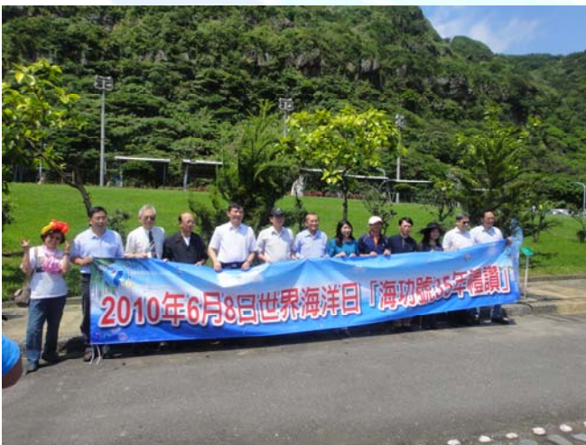
由胡副主委、沙署長等長官一起參加守護海洋宣示

揭開序幕，並由和平國小學童帶來龍魚陣的表演，接著展開一連串的活動，包括「珍愛地球、守護海洋」宣言創意徵文競賽、碧砂漁港-海功號「漁業界參與造林減碳」活動、基隆嶼淨島活動、海洋議題座談會及藝術展覽活動，為守護海洋之永續發展而努力，並使台灣與世界接軌。「珍愛地球、守護海洋」宣言創意徵文競賽，主要由基隆市海洋資源教育中心的和平國小、八斗國小學童參加，共徵選10名優秀作品並在活動當天頒獎。碧砂漁港-海功號「漁業界參與造林減碳」活動，則在林務局羅東林管處協助下，由與會來賓、原海功號成員及海洋宣言獲獎者一起參與植樹。